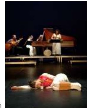
Café-Passion / Opéra-Slam

Elle mène un travail de recherche continue sur l'œuvre de Jon Fosse et propose régulièrement des lectures et mises en espaces de ses pièces ou romans.